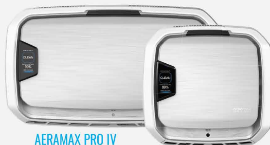
AERAMAX PRO IV FINO A 130mq

INTELLIGENTI: Tecnologia brevettata PureView che mostra in tempo reale la qualità dell'aria