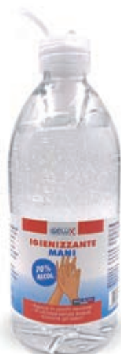
FORMATO MEDIO 500 ml