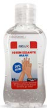
FORMATO POCKET 80 ml