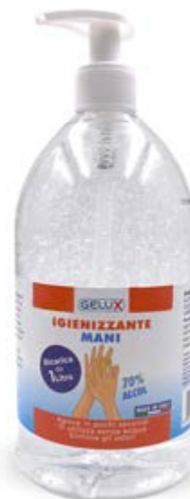
FORMATO DISPENSER 1000 ml