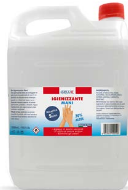
FORMATO TANICA 5000 ml